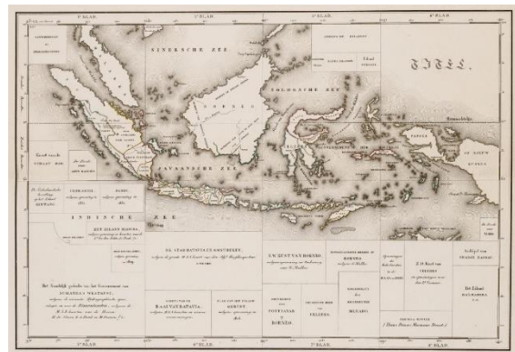
Kaart Nederlandsch Oost-Indië, THA (400), inv.nr. 15

Tussen 1 juli 2023 en 1 juli 2024 (herdenkingsjaar Slavernijverleden) zal het RAZU haar archiefstukken rondom dit onderwerp toegankelijk maken. De gedachte dat slavernij en koloniaal-verleden in de regio Zuid-Utrecht niet heeft gespeeld, lijkt geen stand te houden. Echter, momenteel is het nog niet duidelijk welke bronnen het archief in haar collectie heeft over het koloniaal – en het slavernijverleden. Het doel is om met een vrijwilligersgroep onderzoek te doen naar deze stukken in ons archief over het koloniaal – en het slavernijverleden in onze regio. Vanuit de gevonden stukken kunnen verhalen uitgewerkt worden door middel van diepgaander onderzoek. Hiermee wordt een digitale expositie ontwikkeld, waar mogelijk binnen de context van het grotere verhaal. Daarnaast presenteren we deze verhalen op expositieborden in de gemeentehuizen, hierdoor wordt dit verhaal breed gecommuniceerd. Tot slot worden de archiefstukken ontsloten als thema 'Slavernijverleden' op het Geschiedenislokaal.