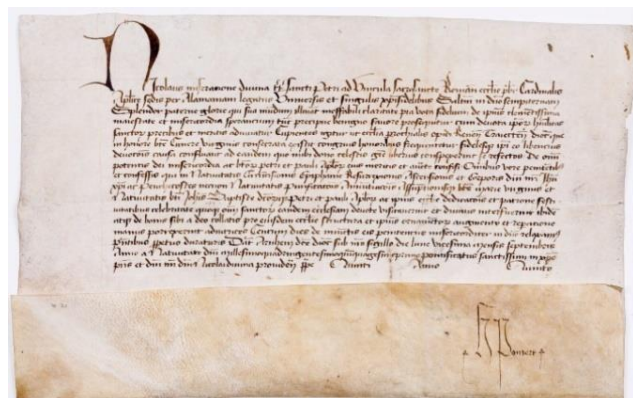
Aflaatbrief uit 1451 (van 100 dagen) van kardinaal Nicolaas van Cusa. Archieftoegang Stadsbestuur Rhenen (152), inv.nr.

Het RAZU heeft interessante stukken in de collectie over dit onderwerp, zoals de oprichtingsakte van de St. Cunera- en Heilige Sacramentsgilde. Ook beschikt het archief over een aflaatbrief (van 100 dagen) van kardinaal Nicolaas van Cusa voor de bezoekers van de Cunerakerk. Daarnaast werken het museum en het archief samen voor het organiseren van aansluitende publieksactiviteiten, te denken valt aan lezingen, kinderworkshops, wandelroutes, etc.